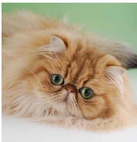
NW SC JW Persefelis Nynne DSM Ejer: Sylvia & Allan Outrup